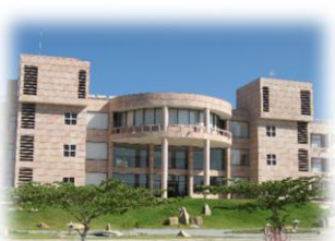
インド開発センター