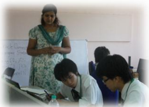
プロジェクト体験研修