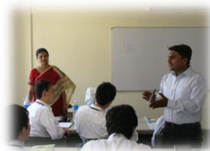
ビジネス英語研修