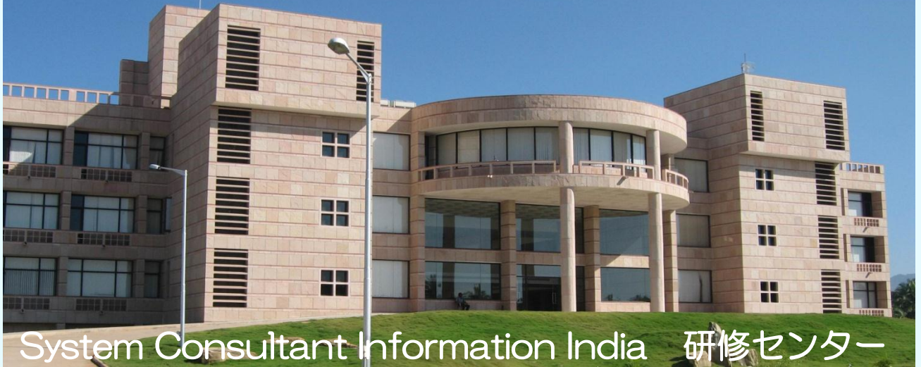
System Consultant Information India 研修センター

当研修センターのあるトムクールは、年間を通じて気候が温暖で、研修に最適な環境です。